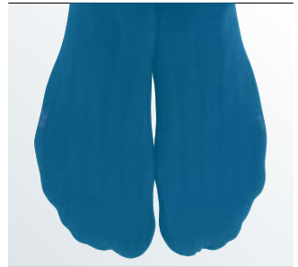
Anatomisch geformte Fußspitze mit der praktischen Rechts-, Links-kennzeichnung